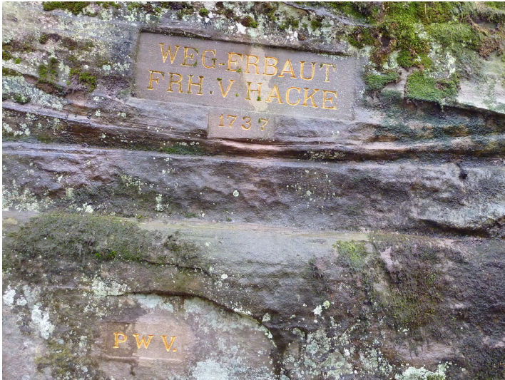
Ritterstein Nr. 122 Weg erbaut Frh. v. Hacke 1737" zwischen Johanniskreuz und Elmstein (2014)