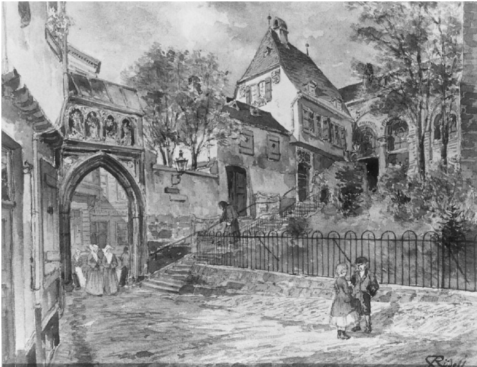
Aquarell auf Papier von Carl Rüdell (zwischen 1880 und 1900): Das Kölner Dreikönigspfortchen an Sankt Maria im Kapitol. Fotograf/Urheber: Carl Rüdell