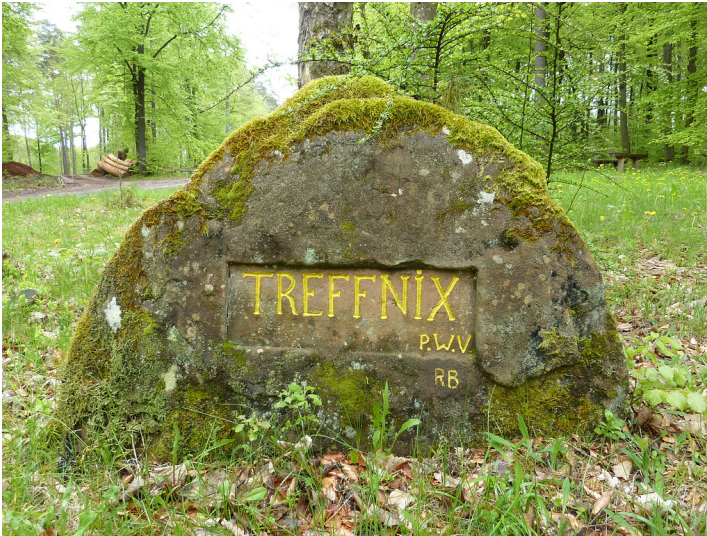
Ritterstein Nr. 104 Treffnix nordöstlich von Iggelbach (2013)