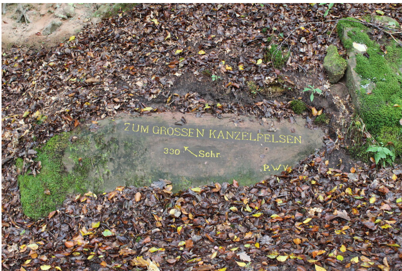
Ritterstein Nr. 103 "Zum großen Kanzelfelsen 330 Schr." südwestlich von Helmbach (2021)