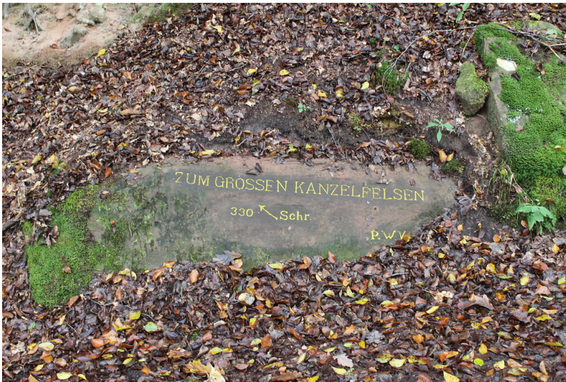
Ritterstein Nr. 103 "Zum großen Kanzelfelsen 330 Schr." südwestlich von Helmbach (2021)