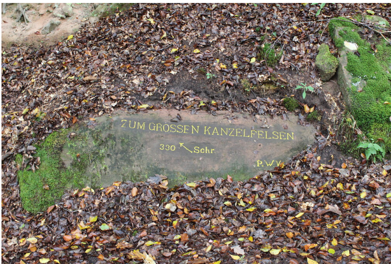
Ritterstein Nr. 103 "Zum großen Kanzelfelsen 330 Schr." südwestlich von Helmbach (2021)