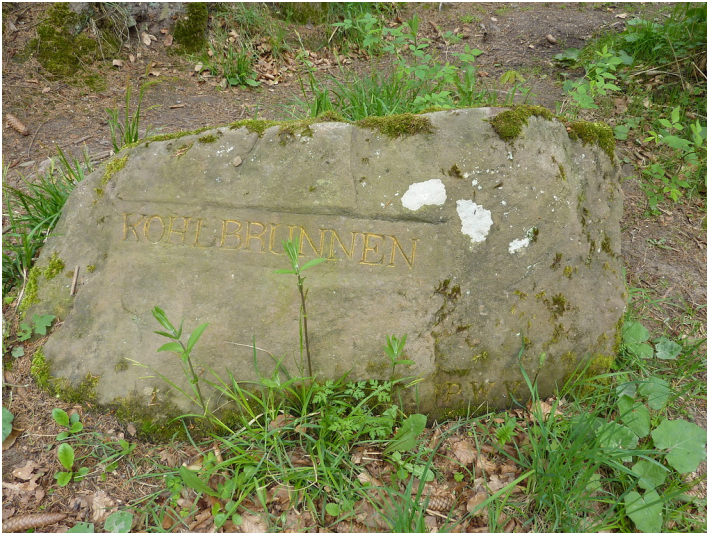
Ritterstein Nr. 99 Kohlbrunnen südöstlich vom Helmbachweiher (2013)