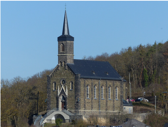
Katholische Pfarrkirche St. Marien in Niedertiefenbach (2021)