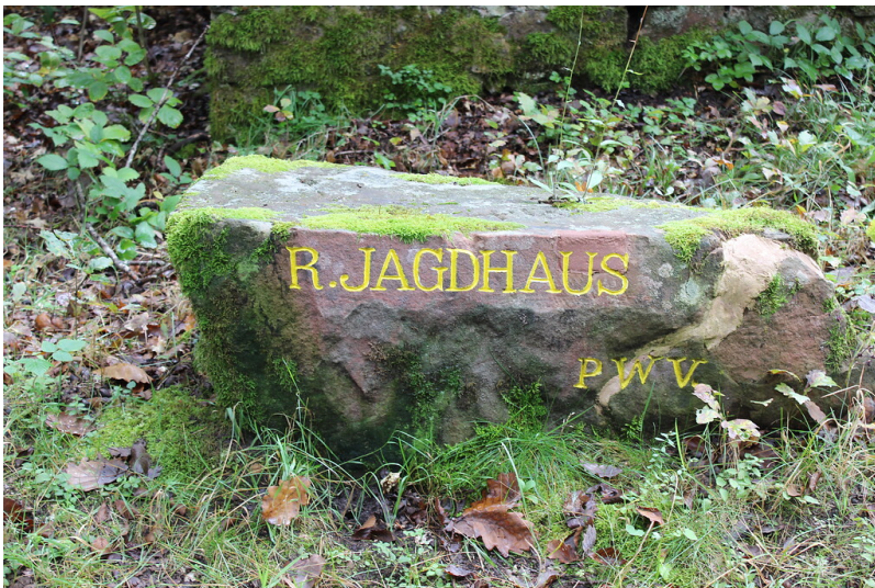
Ritterstein Nr. 97 "R. Jagdhaus" westlich von Iggelbach (2021)