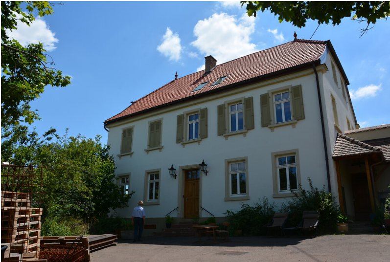
Blick auf das alte Schulhaus in Weitersweiler, Frontansicht (2020)