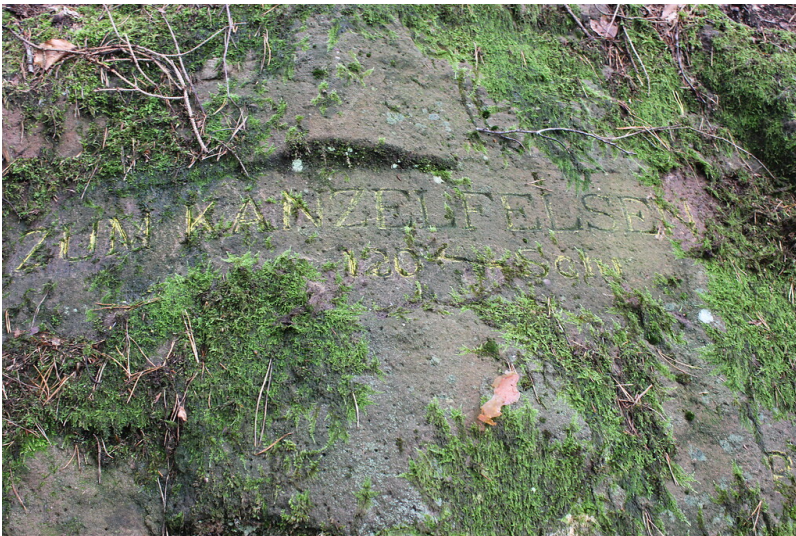
Ritterstein Nr. 91 "Zum Kanzelfelsen 120 Schr." westlich vom Hambacher Schloss (2021)