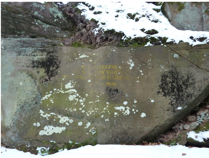
Ritterstein Nr. 90 Zum Kanzelfelsen mit den Inschriften der Teilung der Haingerade 108 Schr. westlich vom Hambacher Schloss (2013)