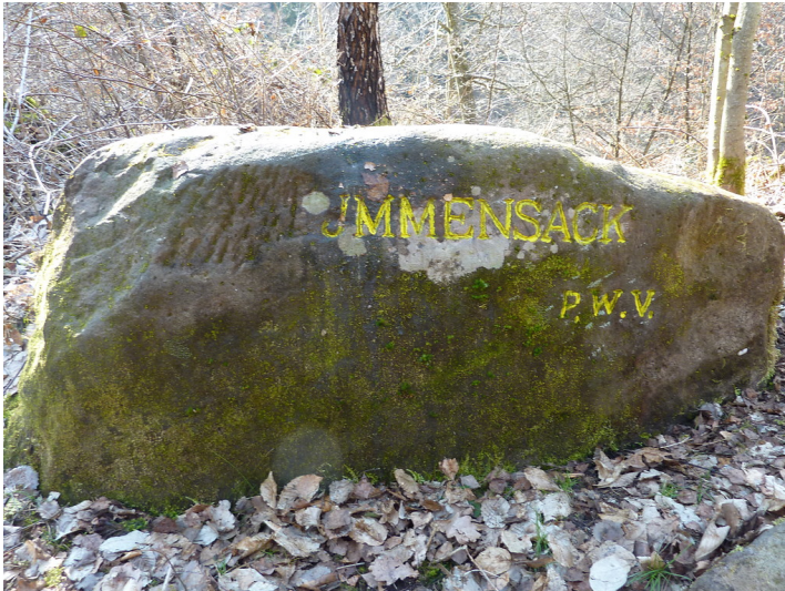
Ritterstein Nr. 89 Immensack an der Geiswiese südlich von Iggelbach (2013)