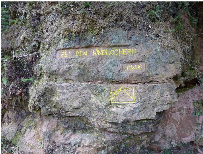
Ritterstein Nr. 88 Bei den Windlöchern südlich von Iggelbach (2013)