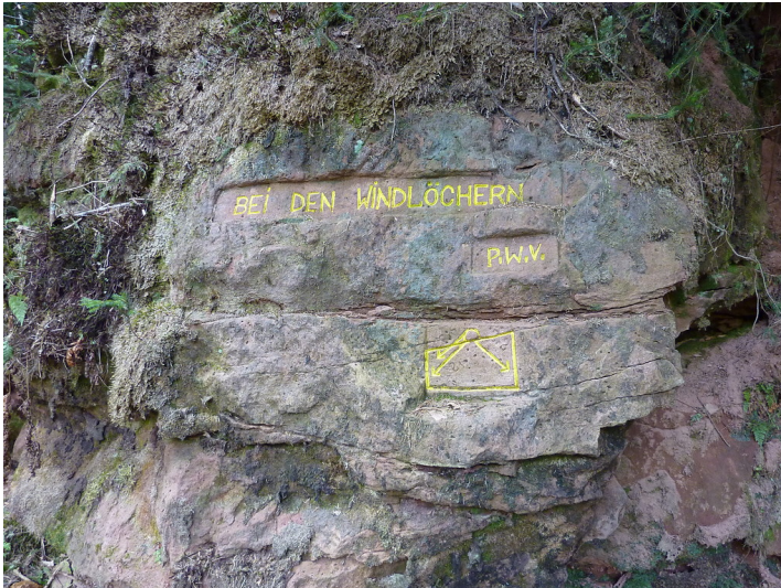
Ritterstein Nr. 88 Bei den Windlöchern südlich von Iggelbach (2013)