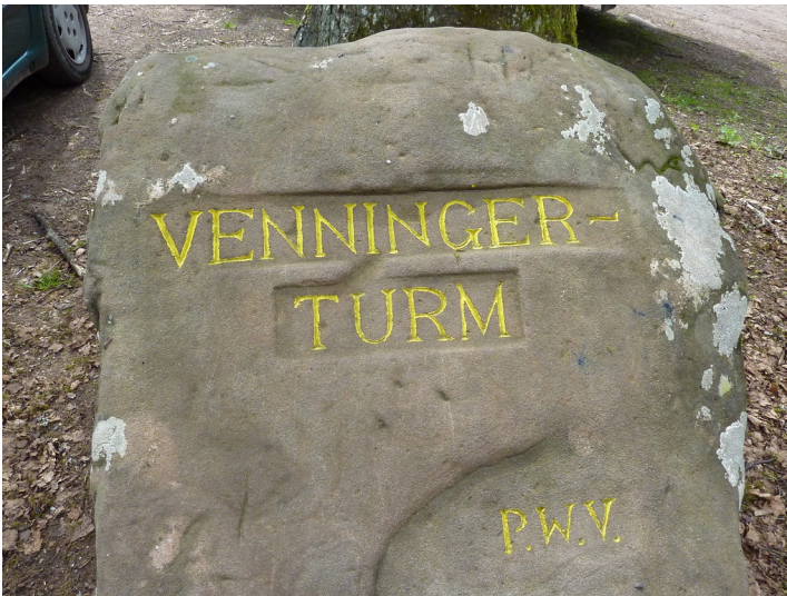
Ritterstein Nr. 87 Venninger-Turm südöstlich von Iggelbach (2013)