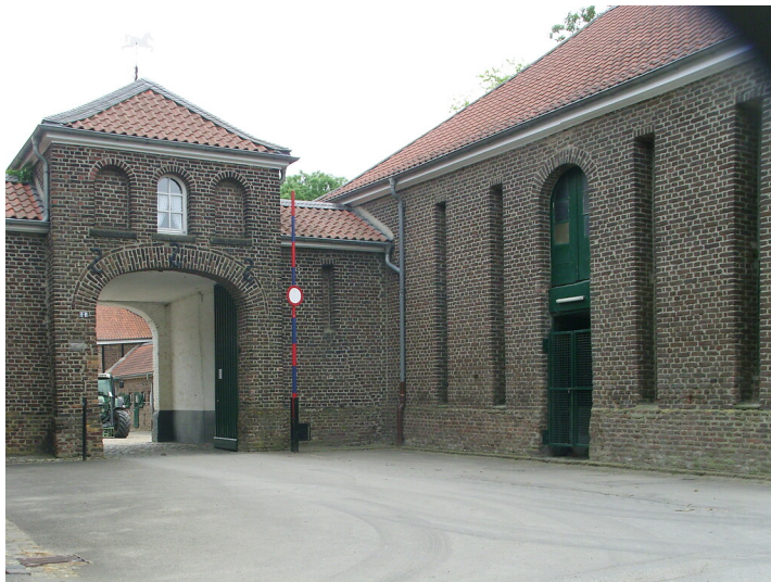
Kurfürstliche Mühlen am Linner Stadtgraben (2020)