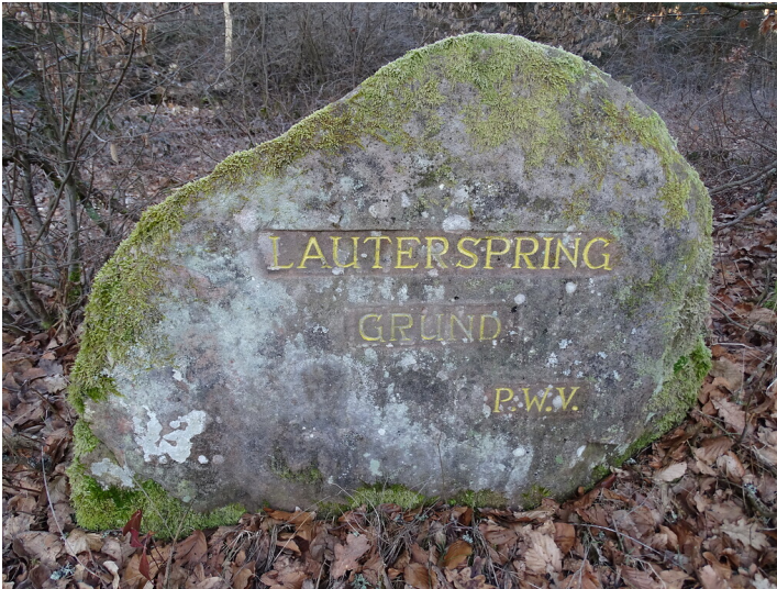
Ritterstein Nr. 294 Lauterspring Grund südöstlich von Kaiserslautern (2019)