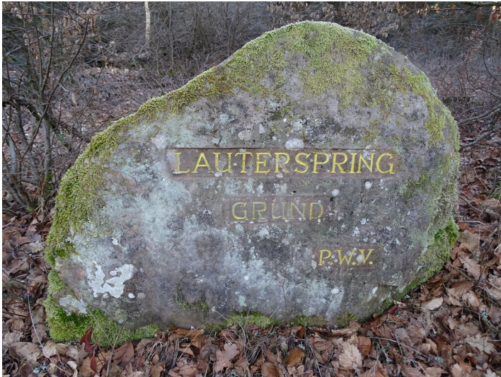
Ritterstein Nr. 294 Lauterspring Grund südöstlich von Kaiserslautern (2019)