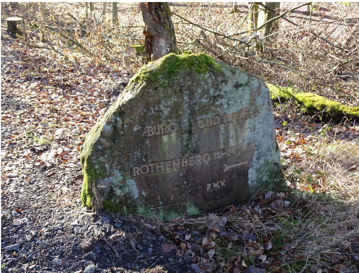
Ritterstein Nr. 292 Burg und Dorf Rothenberg 11.-14. Jhrdt. südwestlich von Göllheim (2019)