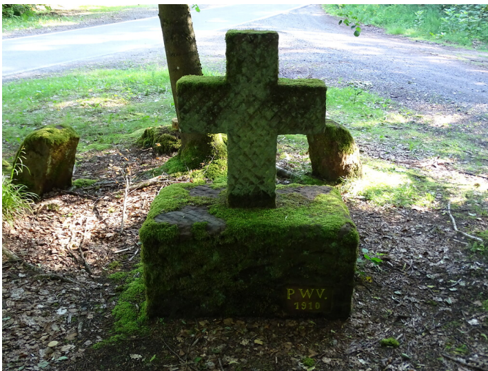
Ritterstein Nr. 132 Steinernes Kreuz 1910 nordwestlich von Esthal (2019)