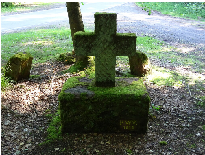
Ritterstein Nr. 132 Steinernes Kreuz 1910 nordwestlich von Esthal (2019)