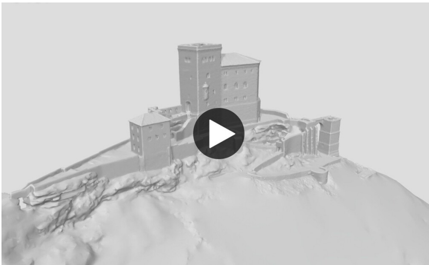
3D-Modell der Burg Trifels bei Annweiler am Trifels (2025)