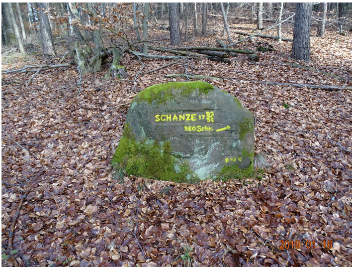
Ritterstein Nr. 144 Schanze 1793/94 360 Schr. nordwestlich von Waldleiningen (2019)