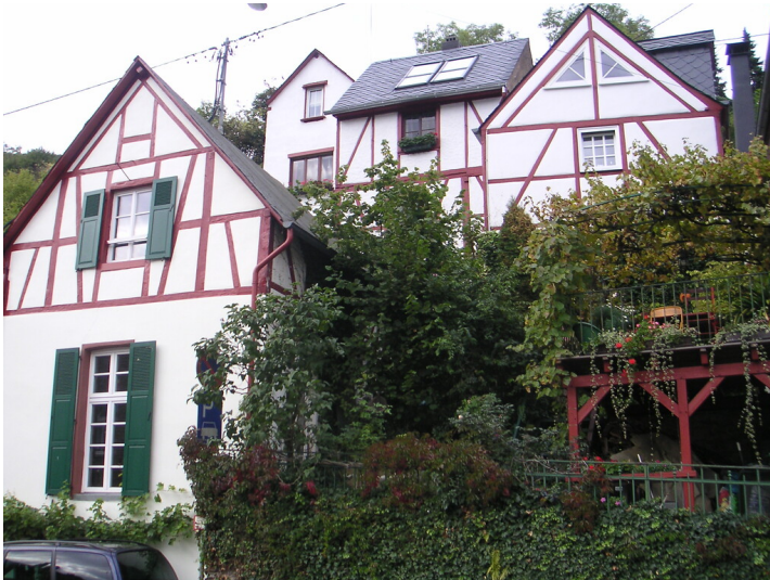
Fachwerkhaus Hauptstraße 75 in Briedel (2005)