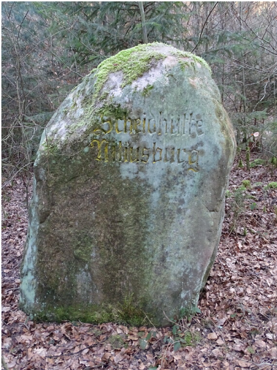
Ritterstein Nr. 264 Scheidhütte Niliusburg südöstlich von Kaiserslautern (2019)