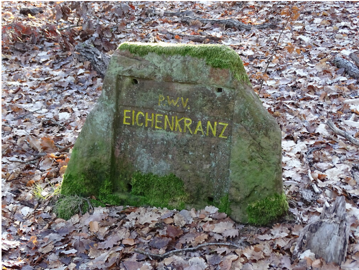
Ritterstein Nr. 266 Eichenkranz bei Kaiserslautern (2019)