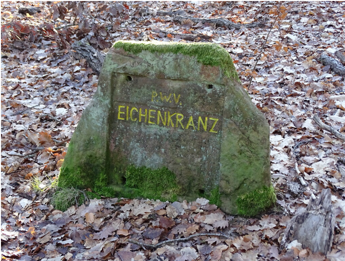
Ritterstein Nr. 266 Eichenkranz bei Kaiserslautern (2019)