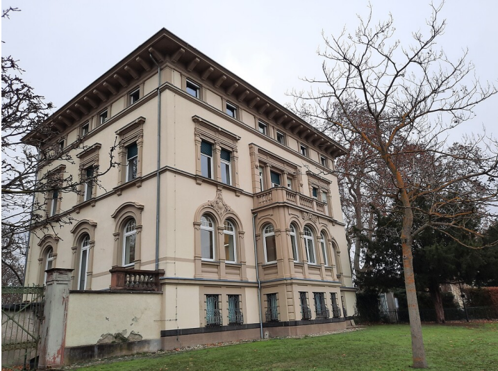
Südseite der Villa Burgeff in Hochheim am Main von der Mainzer Straße aus fotografiert (2020).