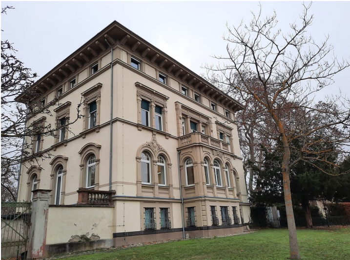
Südseite der Villa Burgeff in Hochheim am Main von der Mainzer Straße aus fotografiert (2020).