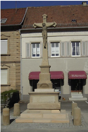
Das Steinerne Kreuz Lauterecken (2012).

Schlagwörter: Gedenkkreuz Fachsicht(en): Landeskunde Gemeinde(n): Lauterecken Kreis(e): Kusel Bundesland: Rheinland-Pfalz