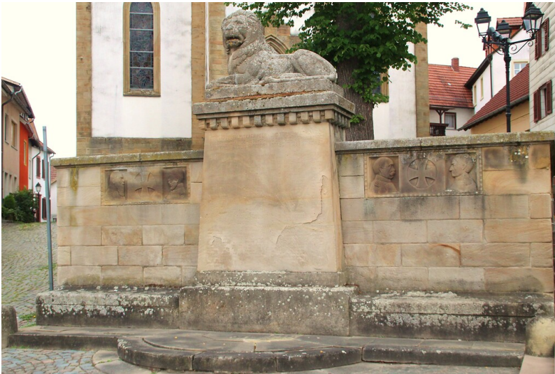
Kriegerdenkmal am Veldenzplatz (2020).