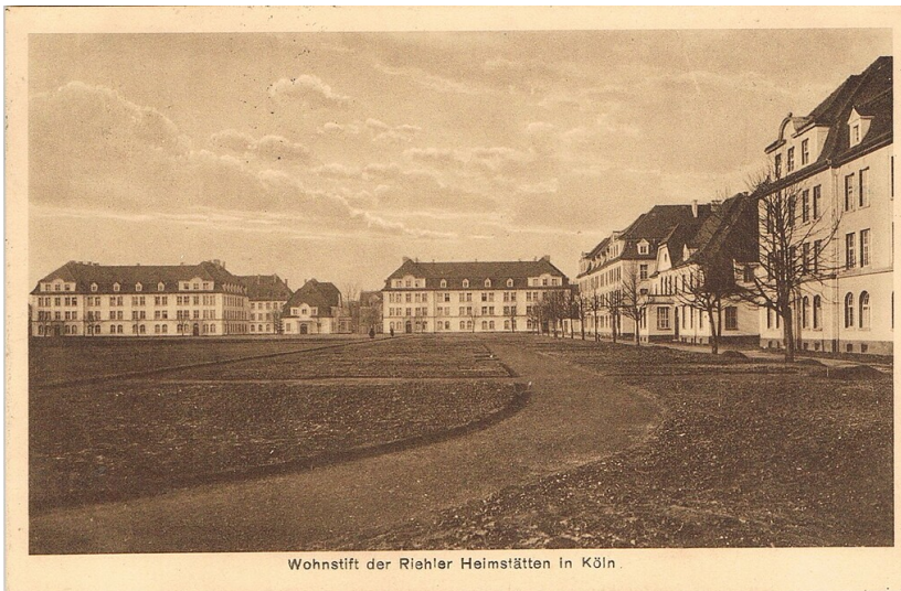
Historische Postkarte (nach 1927): "Wohnstift der Riehler Heimstätten in Köln".