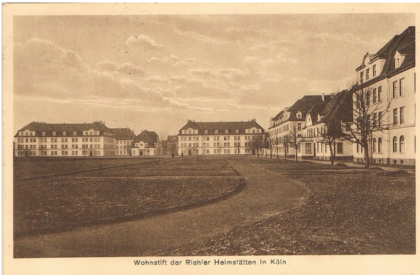
Wohnstift der Riehler Heimstätten in Köln.

Historische Postkarte (nach 1927): "Wohnstift der Riehler Heimstätten in Köln".