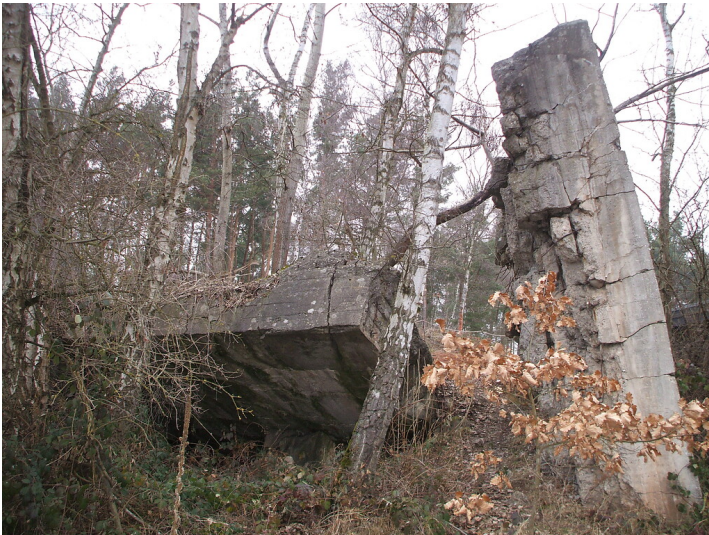
Teillruine eines Bunkers und Reste einer Flakstellung in Mechernich-Kommern (2006).