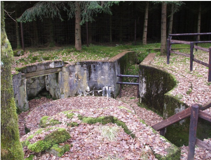
Reste einer Flakstellung und eines darunter liegenden Wasserbunkers in Dahlem-Schmidtheim (2020).