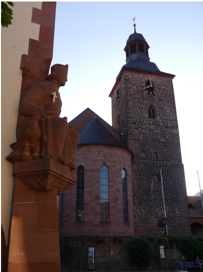
Blick auf die Außenskulptur Friedrichs II. am Rathaus und die Stadtkirche in Annweiler am Trifels (2020)