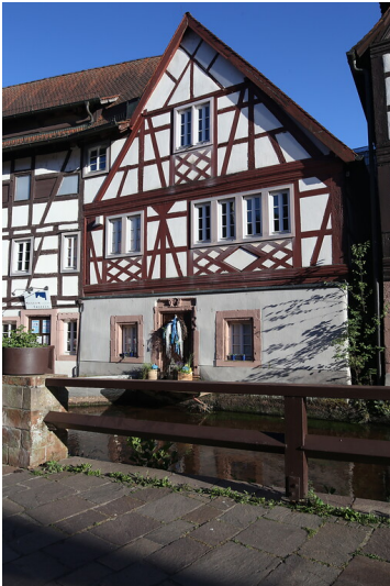
Fachwerkhaus an der Queich in Annweiler, in dem das "Museum unterm Trifels" untergebracht ist (2020)