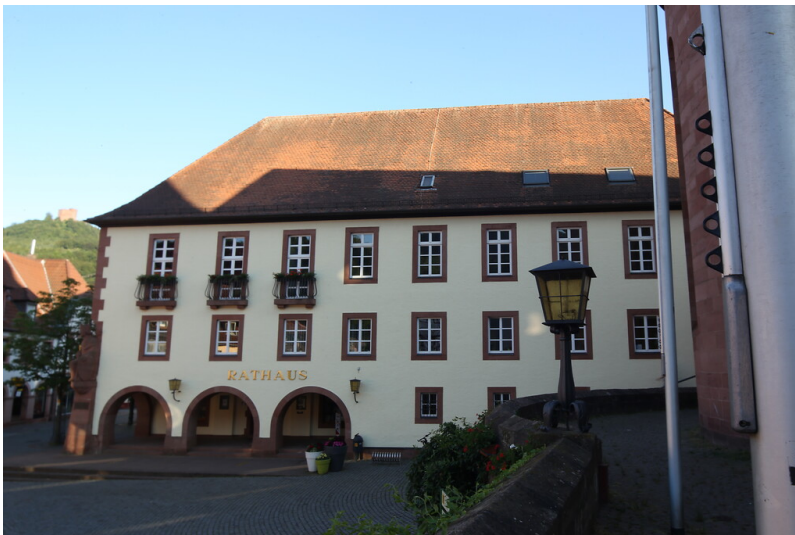
Blick auf das Rathaus Annweiler am Trifels von der Stadtkirche aus (2020)