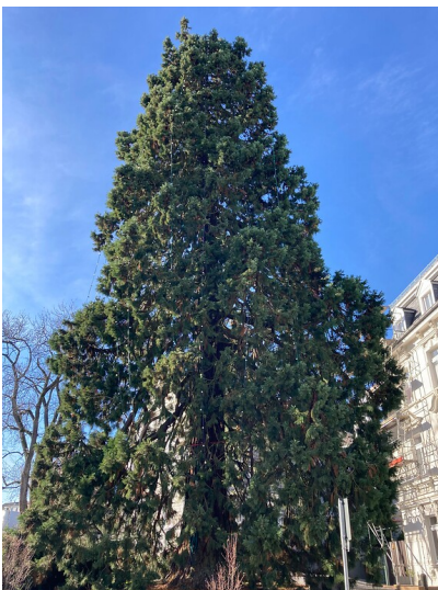
Naturdenkmal Riesen-Mammutbaum in Wermelskirchen (2020)