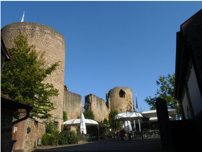
Burgruine Neuleiningen (2021)