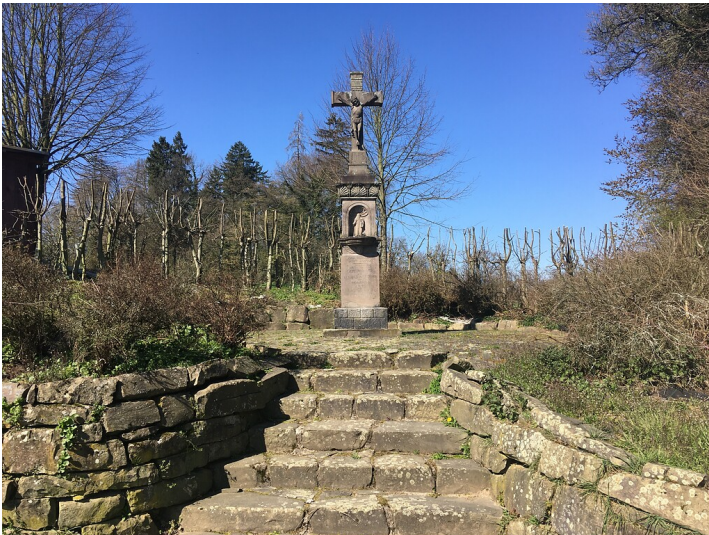
Wegekreuz Unterhombach (2020)