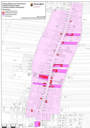
Denkmalkarte der Denkmalzone "Ortskern Herxheim-Hayna" (2019)