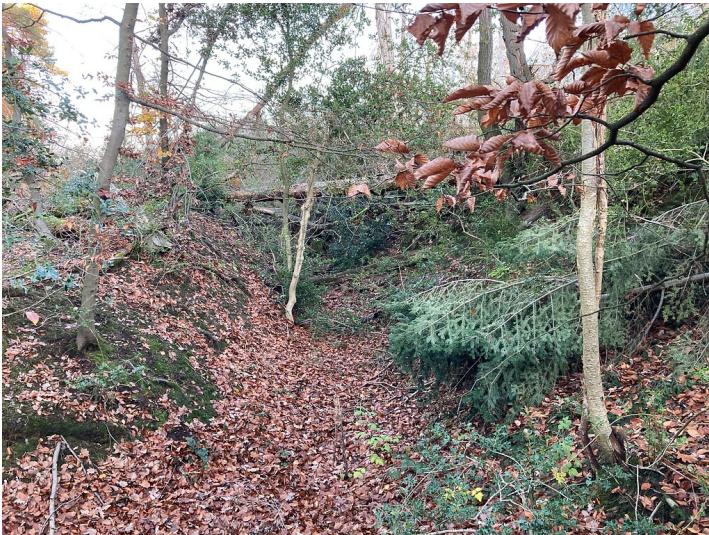
Bodendenkmal Hohlwegesystem Hardt (2020)