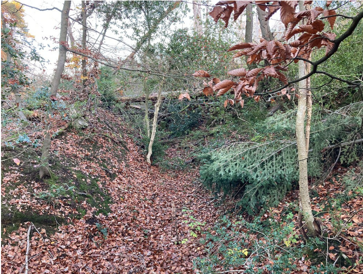
Bodendenkmal Hohlwegesystem Hardt (2020)