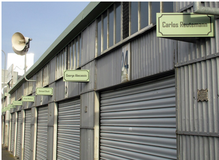
Blick über die Boxen 14-24 in der nordöstlichen Reihe der Garagen im historischen Fahrerlager am Nürburgring (2020).