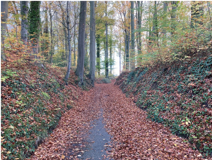
Hohlweg Trotzenburger Weg (2020)