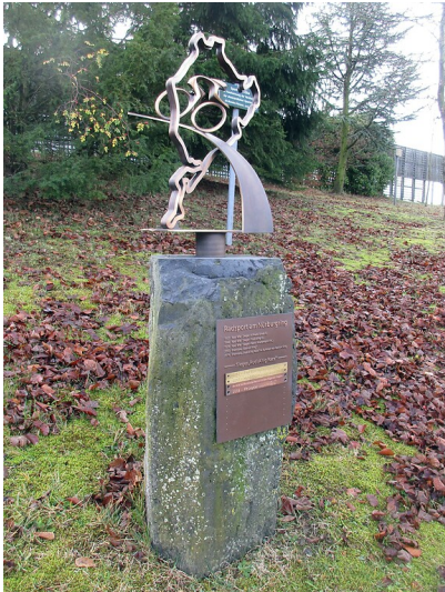
Das Denkmal an der Automobilrennstrecke Nürburgring erinnert daran, dass der "Ring" auch Austragungsort zahlreicher Radsportwettbewerbe war, u.a. wurde hier 1927, 1966 und 1978 die Rad-WM ausgetragen (2020).