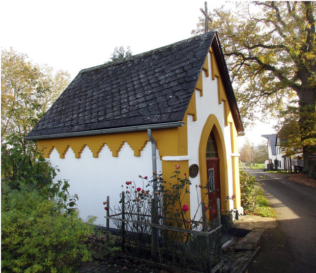
Die kleine Hofkapelle an den Windhäuser Höfen auf der Moselhöhe oberhalb von Karden (2020).