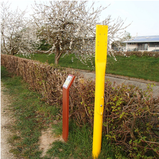
Erzählstation "Brauweiler Ronne" am Kölner Randkanal (2014)