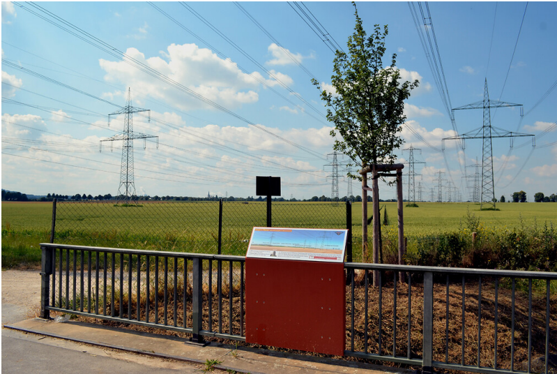
Erzählstation "Panorama Lövenich" am Kölner Randkanal (2014)