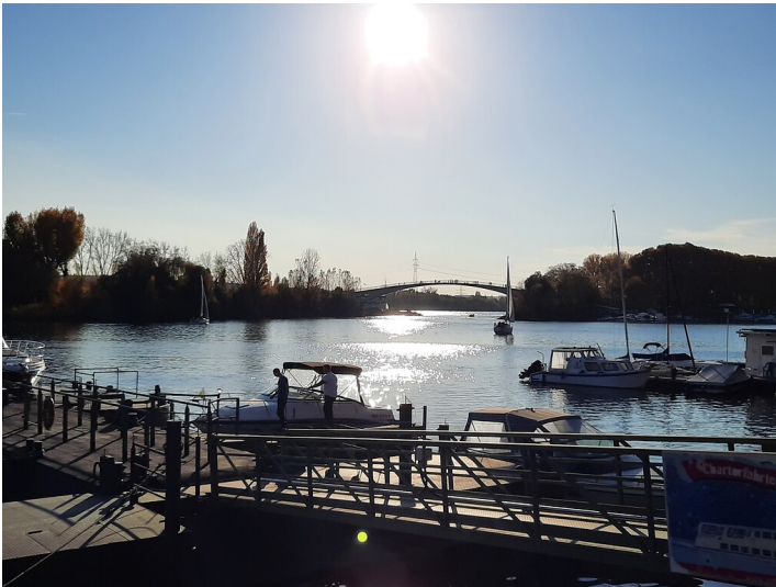
Der Binnenhafen von Wiesbaden-Schierstein (2020).